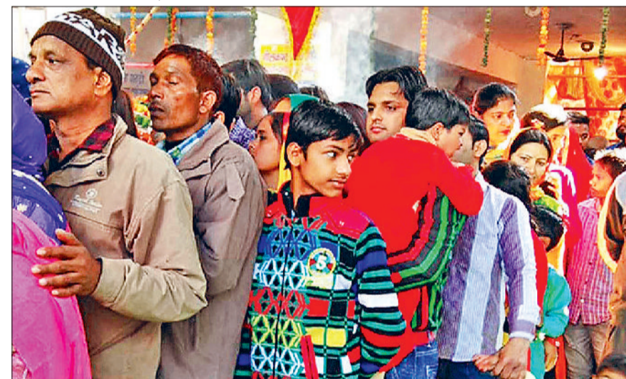
यमुनानगर। मां के मंदिरों में माथा टेकने के लिए लाइन में लगे हुए श्रद्धालु।

मां के मंदिरों में उमड़ी मीड़ मंगलवार सुबह होते ही मां भगवती के जिला स्थित मां दुर्गा के मंदिरों में भक्तों की भीड़ उमड़नी शुरू हो गई थी। खास बात यह रही कि