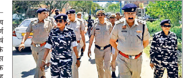
पानीपत में पल्लेग मार्च करती फोर्स।