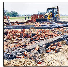
यमुनानगर। गांव चंदाखेड़ी में अवैध कॉलोनीयों में निर्माण कार्य को ध्वस्त करती हुई जेसीबी मशीन।

जिला नगर योजनाकार विभाग की जिले में बन रही अवैध कॉलोनीयों पर कार्रवाई जारी है। इसी कार्रवाई के चलते मंगलवार को जिला योजनाकार विभाग की टीम ने गांव चंदाखेड़ी व शाहपुर में चार एकड़ में बन रही दो कॉलोनीयों में वहां किए गए अवैध निर्माण कार्य को जेसीबी मशीन से ढहा दिया। मंगलवार को नगर योजनाकार विभाग की टीम जिला नगर योजनाकार डीआर