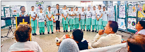
अंबाला। कार्यक्रम में प्रस्तुति देते नर्सिंग की छात्राएं व मौजूद लोग।

विश्व स्वास्थ्य दिवस द्वारा "मेरा स्वास्थ्य, मेरा अधिकार" की थीम के साथ सभी के लिए स्वास्थ्य के अधिकार को पूरा करने की तत्काल आवश्यकता पर प्रकाश डालने की एक प्रभावशाली कोशिश है। 1 विश्व की आबादी के आधे से अधिक लोगों - को आवश्यक स्वास्थ्य देखभाल नहीं मिलती। इसके अलावा, 2 अरब से अधिक लोग बुनियादी स्वास्थ्य देखभाल तक पहुंचने में वित्तीय कठिनाई का अनुभव करते हैं। इन सब मुद्दों से