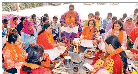
यमुनानगर। डीएवी गर्ल्स कॉलेज में आयोजित हवन यज्ञ में आहुति डालती प्राचार्या व अन्य।